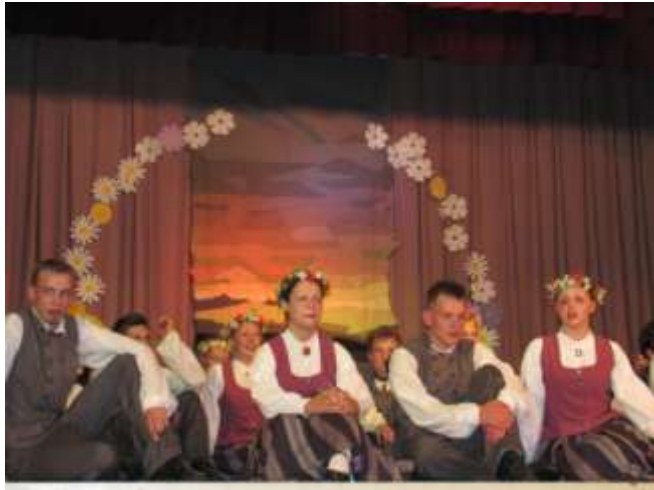
JDK „Dūmiņš” koncertā „Pa saules staru”